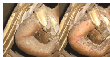
As Carretas a intervencionar...

Já é possível ver diferenças no altar da igreja da Misericórdia. A intervenção que vinha a ser desenvolvida apenas por uma técnica até março foi reforçada com mais um técnico.