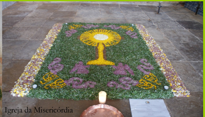
Igreja da Misericórdia