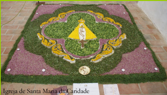
Igreja de Santa Maria da Caridade