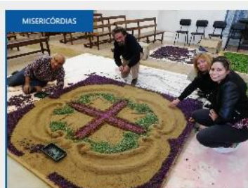
Misericórdia do Sardoal preparou tapetes de flores para a Semana Santa

A página da Misericórdia no facebook tem possibilitado uma maior divulgação da Instituição, a partir de um post a União das Misericórdias Portuguesas solicitou o envio de fotos alusivas ao acontecimento que foi integrado no jornal “voz das Misericórdias e no Site da União das Misericórdias Portuguesas.