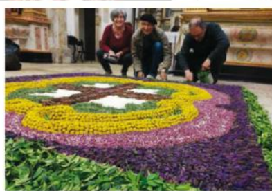
Sardoal Utentes, funcionários e dirigentes ajudam a preparar tapetes de flores que enfeitam as igrejas de Sardoal para a Semana Santa