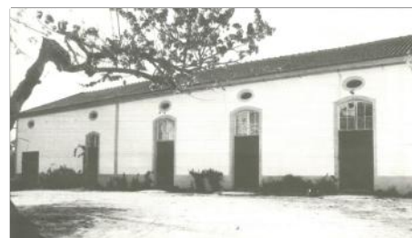
Antigo Cineteatro Gil Vicente