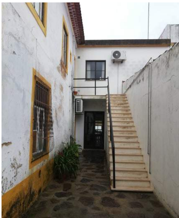
Local atual onde foi (retirada) a fotografia

Conclui-se que o trabalho aqui realizado foi proveitoso, agradecendo a todos os que de alguma forma contribuíram para a identificação das mesmas. Este trabalho foi realizado pelo Setor de Animação Socio-cultural e teve como objetivo a divulgação das fotografias onde se pretendeu demonstrar outros tempos, outros hábitos e outros costumes, tendo como pano de fundo as ligações à Misericórdia.