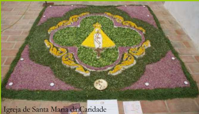
Igreja de Santa Maria da Caridade