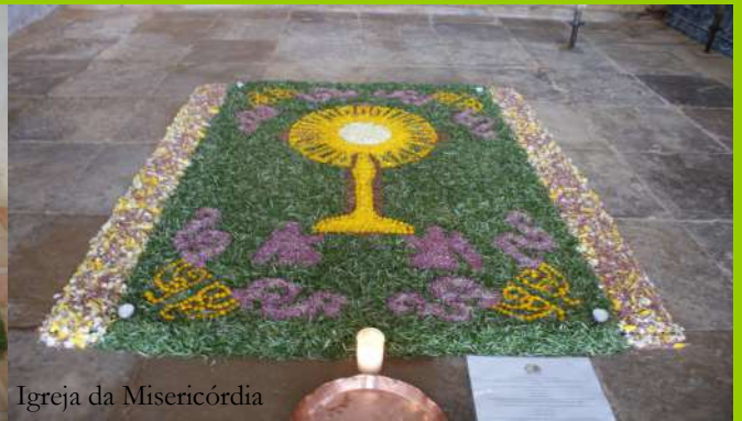
Igreja da Misericórdia