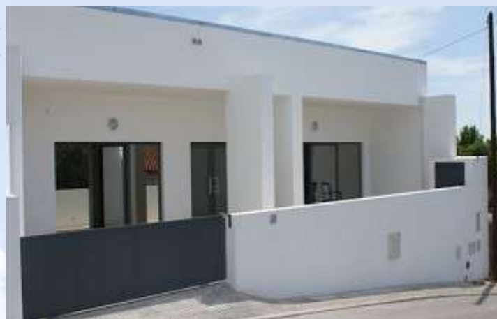
Figura 5: Unidade de Apartamentos Lúcio Serras Pereira

Com o aumento da procura da Resposta Social de ERPI, em 2009 foi inaugurado a Unidade de Apartamentos Lúcio Serras Pereira (figura 5), no Outeiro da Velha, a qual teve capacidade para 13 Utentes.