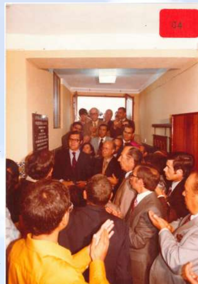
Figura 1: Inauguração Centro de Dia (figura1), na atual sede da Filarmónica União Sardoalense (ver boletim da Misericórdia nº 25 da 3ª Série).