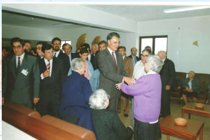
Figura 3: Inauguração Centro Santa Maria da Caridade

Em virtude da Resposta Social de Centro de Dia ter sido deslocado para o Centro de Santa Maria da Caridade, em 1998 foi inaugurado a Creche/Jardim de Infância da Misericórdia (figura 4), a qual funcionou até 2020, tendo a mesma fechado devido a grandes constrangimentos financeiros que a institui-