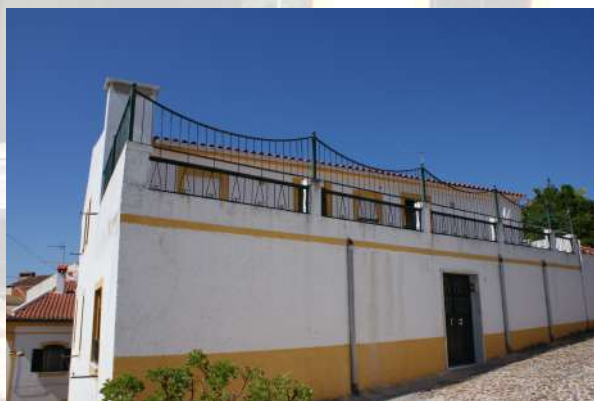
Figura 4 : Antiga Creche da Misericórdia

Nessa mesma década, devido às crescentes necessidades de carácter social foi necessário avançar para outras Respostas Sociais. Desta forma, nasceu o projeto de construção do Centro de Santa Maria da Caridade em 1988. Para esta obra foi utilizado o espaço onde estava sediado o Cine-teatro Gilvicente, também pertença à SCMS (apresentava grande necessidades de obras) e uma parte do edifício do antigo Hospital, contando-se com uma grande mobilização da comunidade para a sua construção, o qual foi inaugurado em 1994 (ver boletim da Misericórdia nº 21 da 3ª Série alusivo aos 25 anos do Centro). Este espaço concentrou as Respostas Sociais de Lar/ERPI, Centro de Dia e Serviço de Apoio Domiciliário no mesmo edifício.