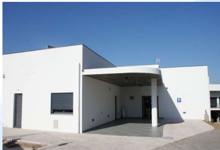
Figura 6: Centro Sr. Jesus dos Remédios

Devido às grandes limitações que o Centro de Santa Maria da Caridade apresentava para as Respostas Sociais, Estrutura Residencial para a Pessoa Idosa/ Centro de Dia em 2015 foi inaugurado o Centro de Dia Senhor Jesus dos Remédios (ver boletim da Misericórdia nº 27 da 3ª Série).