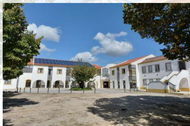
Figura 7: Centro Santa Maria da Caridade