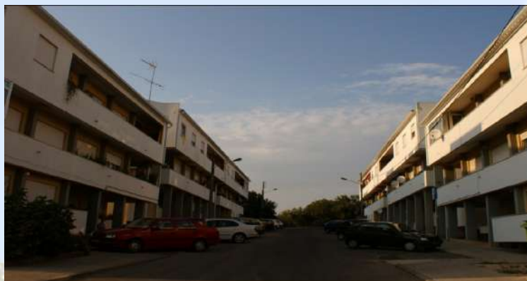
Figura 2: Bairro da Misericórdia

Neste sentido, a Santa Casa da Misericórdia de Sardoal inaugurou a 28 de setembro de 1980 o Centro de Dia num edifício nas ruas velhas do Sardoal