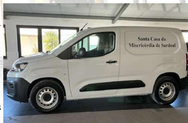
Figura 8: Carrinha de Serviço ao Apoio Domiciliário